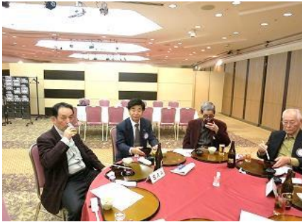
おいしい料理とお酒に笑顔です。