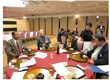
久しぶりの夜間例会。